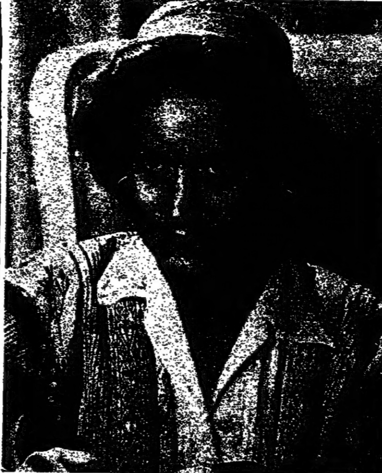
صورة من الأرشيف كتبت المرحومة (السهمان) افتتاحية في كل شيء .. في غنايتها وفي حياء .. وحتى في اشتغالها بالسياسة